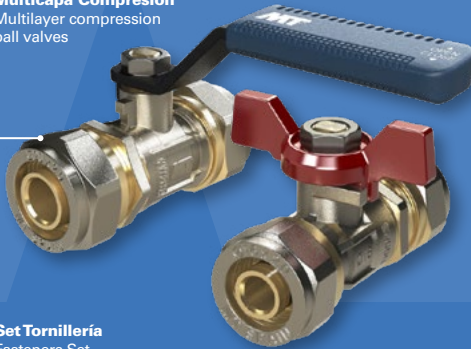
Válvulas esfera Multicapa Compresión Multilayer compression ball valves