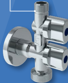
Válvula Escuadra Mixta (Rediseño) Mixed Angle Valve (Redesign)