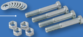
Set Tornillería Fasteners Set