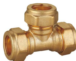
6708 Te igual Equal tee