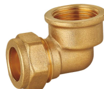
6705 Codo 90° hembra Female elbow 90°