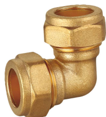
6704 Codo 90° Elbow 90°