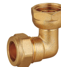
6713 Codo 90° hembra tuerca móvil Female elbow 90° with loose nut