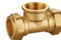
6710 Te hembra Female tee