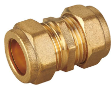
6701 Enlace doble Straight coupling