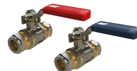
6651 / 66512 Válvula esfera PN-30 palanca inoxidable Ball valve PN-30 stainless handle