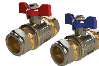
6650 / 66502 Válvula esfera PN-30 mando palomilla Ball valve PN-30 butterfly handle