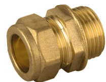
6703 Enlace macho Male straight coupling