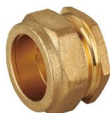
6707 Tapón Cap