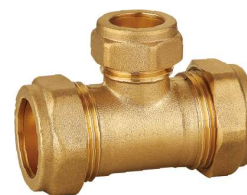
6709 Te reducida Reducing tee