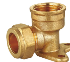
6711 Codo placa Wall plated elbow