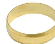
67901 Recambio - Anillo de compresión Spare part - Compression ring