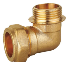
6706 Codo 90° macho Male elbow 90°