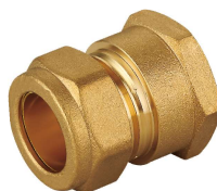
6702 Enlace hembra Female straight coupling