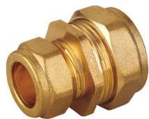
6701R Enlace doble reducción Reducing straight coupling